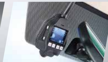
CAMERA HÀNH TRÌNH