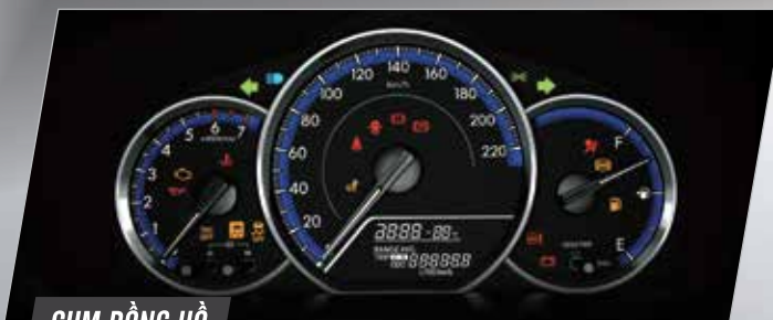
CỤM ĐỒNG HỒ

Thiết kế sang trọng với ghế da đẳng cấp và tông màu be trẻ trung, thân thiện.