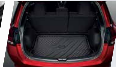
KHAY HÀNH LÝ