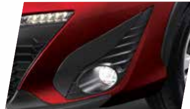
ỐP TRANG TRÍ ĐÈN SƯƠNG MÙ (MÀU ĐEN SẼN)

Khách hàng hoàn toàn yên tâm khi vận hành dù trong không gian nhiều chướng ngại vật.