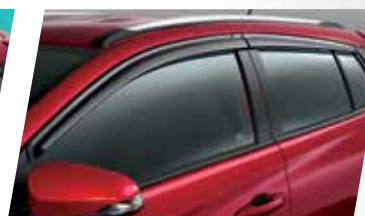
VÈ CHE MƯA