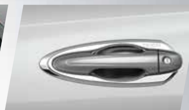
BỘ TAY ỐP CỬA MẠ CRÔM