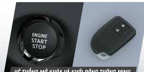
HỆ THỐNG MỞ KHÓA VÀ KHỞI ĐỘNG THÔNG MINH

Không gian rộng rãi, tiện nghi, được mở rộng với độ ngả ghế 25 độ, tựa đầu ôm phía trước với kết cấu giảm chấn thương cổ giúp hành khách thoải mái, thư giãn và an tâm khi di chuyển.