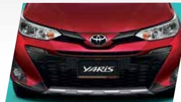
ỐP TRANG TRÍ PHÍA DƯỚI CẢN TRƯỚC