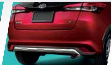
ỐP TRANG TRÍ PHÍA DƯỚI CẢN SAU