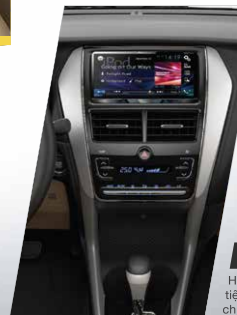
BẢNG ĐIỀU KHIỂN TRUNG TÂM

Tay lái của xe Yaris mới được thiết kế sang trọng, tinh tế với chất liệu da, mạ bạc, 3 chấu vừa vận với vị trí đặt tay. Ngoài ra vô lăng có thể điều chỉnh 2 hướng và tích hợp các nút điều chỉnh âm thanh giúp tối đa hóa tiện ích sử dụng.