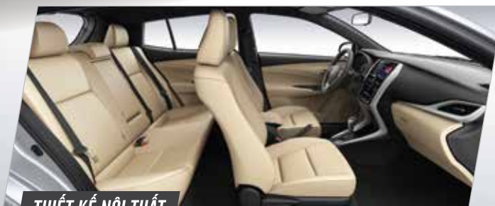
THIẾT KẾ NỘI THẤT

Cụm đồng hồ OPTITRON với màn hình hiển thị đa thông tin tạo sự kết nối thân thiện, thông minh và hiện đại.