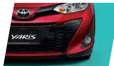
ỐP HƯỚNG GIÓ CẢN TRƯỚC