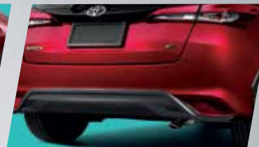
ỐP HƯỚNG GIÓ CẢN SAU