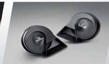
CÒI XE CAO CẤP