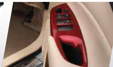
ỐP TRANG TRÍ BẠC NGHỈ TAY (MÀU ĐỎ)