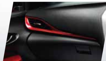
BỘ ỐP TRANG TRÍ TÁP-LÔ (MÀU ĐỎ)