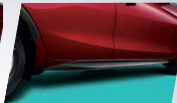
BỘ ỐP SƯỜN XE