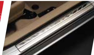
ỐP BẠC LÊN XUỐNG KHÔNG ĐÈN