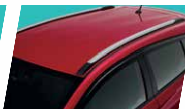
ỐP TRANG TRÍ NÓC XE