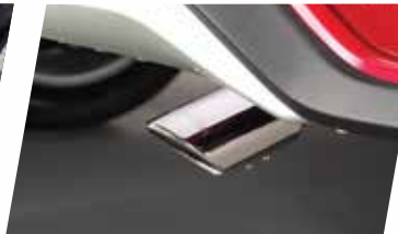
CHỤP ỐNG XẢ